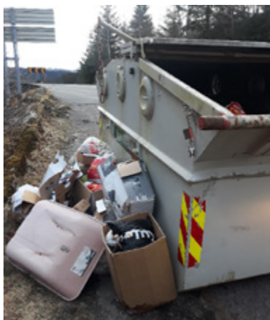
Døme på forsøpling

Returpunkta skal IKKJE brukast til store gjenstandar som bileta viser. Dei skal berre brukast til avfall som du elles hadde kasta i dunkane heime. Det er ein grunn til at lukene på konteinarane er utforma med små innkastluker.