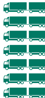
Tilsvarar 7 fullaste vogntog

Det kan vera du tenkjer at du ikkje har bruk for denne dunken, men dei aller, aller fleste av oss har litt glas- og metallemballasje. Det kan vera eit syltetøyglas, ei brusflaske, ein boks makrell i tomat, ein leverposteiboks, ei aluminiumsform det har vore fisk i eller liknande.