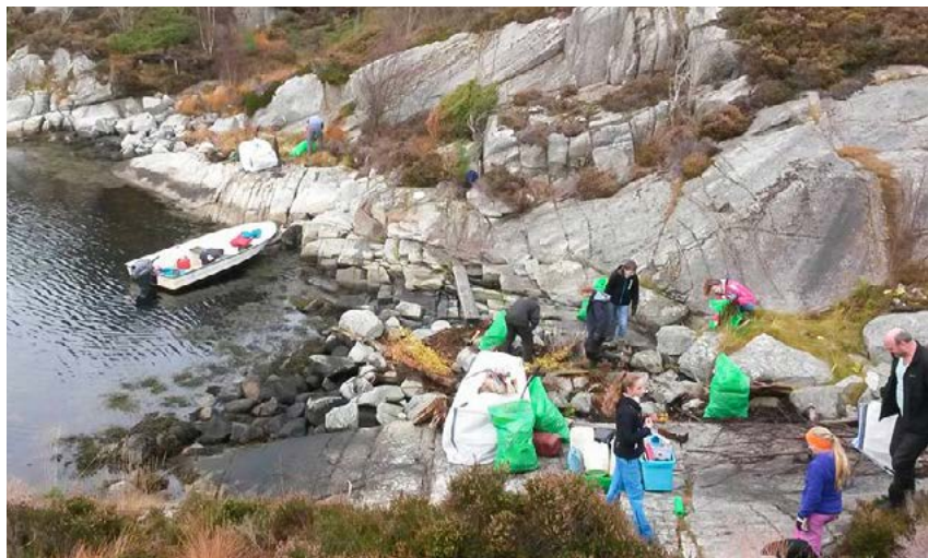
Hausten 2016 rydda gutane i Bremnes IL sitt G 14-lag strender på vestsida av Bømlo.