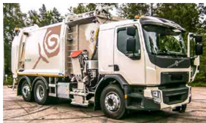
Sidelastar med to kammer (rest + bio).