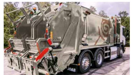
Baklastar med to kammer (papir + plast).