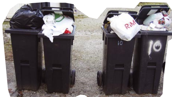
Behaldaren må ikkje fyllast meir enn at loket kan lukkast tett til.