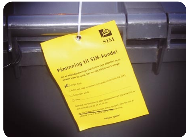
Denne dunken var overfylt og kunden har fått ei påminning frå SIM.