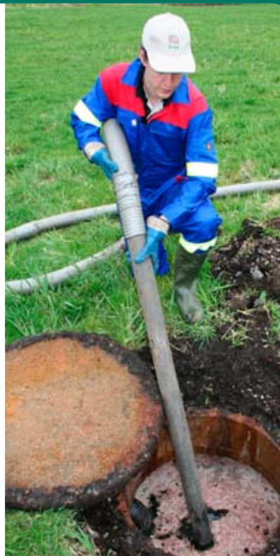
SIM tømmer slamtankar for hus annakvart år og hytter fjerdekvart. Eigarar av tette tankar som opplever at dette ikkje er ofte nok, kan nytta seg av den nye tømmeruta.