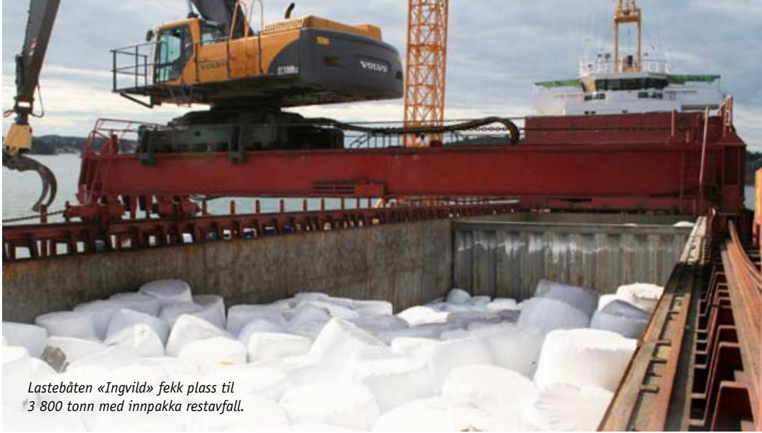
Lastebåten «Ingvild» fekk plass til 3 800 tonn med innpakka restavfall.

Store mengder med innpakka restavfall er den siste månaden blitt køyrt ut frå Svartasmoget, lasta om bord i båt og frakta til energigjenvinning i Sverige.