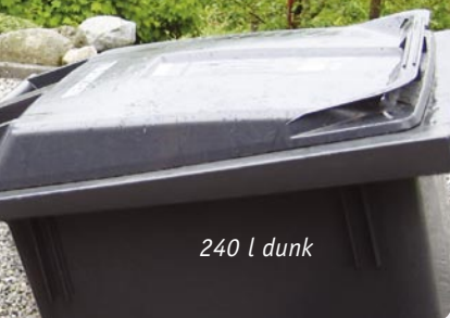
240 l dunk