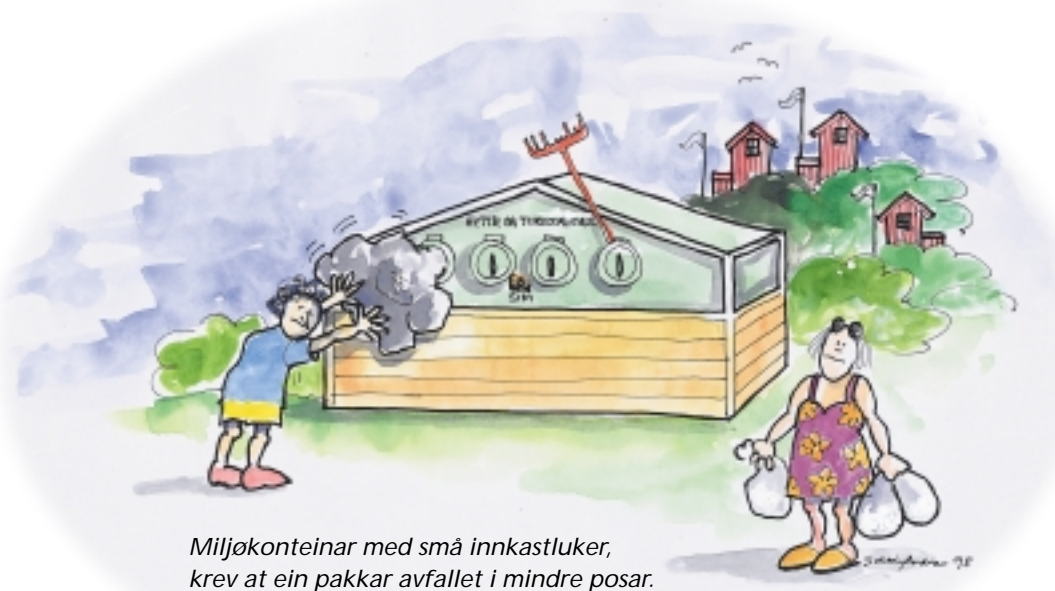
Miljøkonteinar med små innkastluker, krev at ein pakk avfallet i mindre posar.

tilseier at det er mykje feilbruk av hyttekonteinarane, og SIM håpar å redusera dette problemet ved å gå over til små innkastluker. Det er allereie plassert ut nokre hyttekonteinarar med små innkastluker. Problemet er at ikkje alle aksepterer eller skjønner at avfallet må puttast i mindre posar når ein brukar desse, og det hender at avfallet vert plassert utanfor konteinaren.