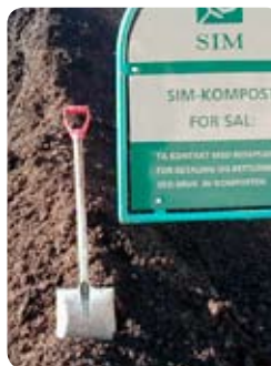
SIM har framifrå kompostjord og plenblanding til sals.