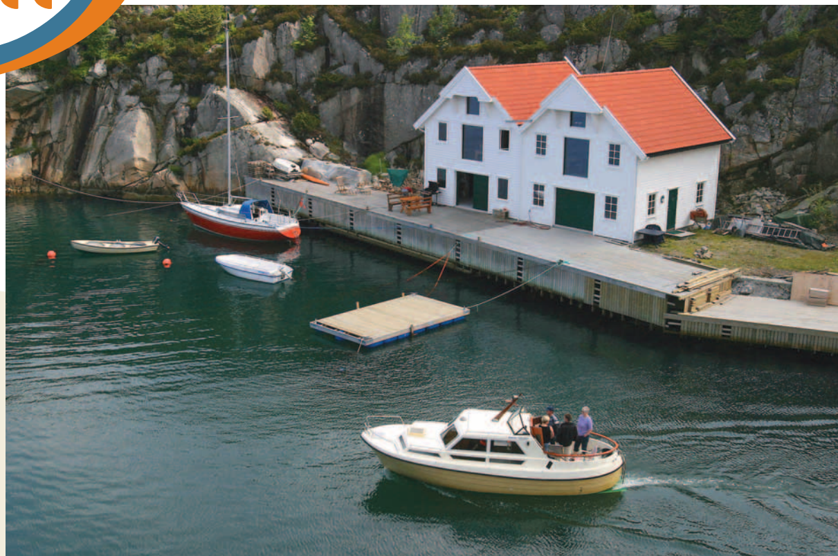
Sommaridyll. Men ikkje utan at renovasjonsordninga fungerer.

Glas og hermetikkboksar kan du kasta i våre glasigloar, som er plassert på sentrale stader kringom i kommunane.